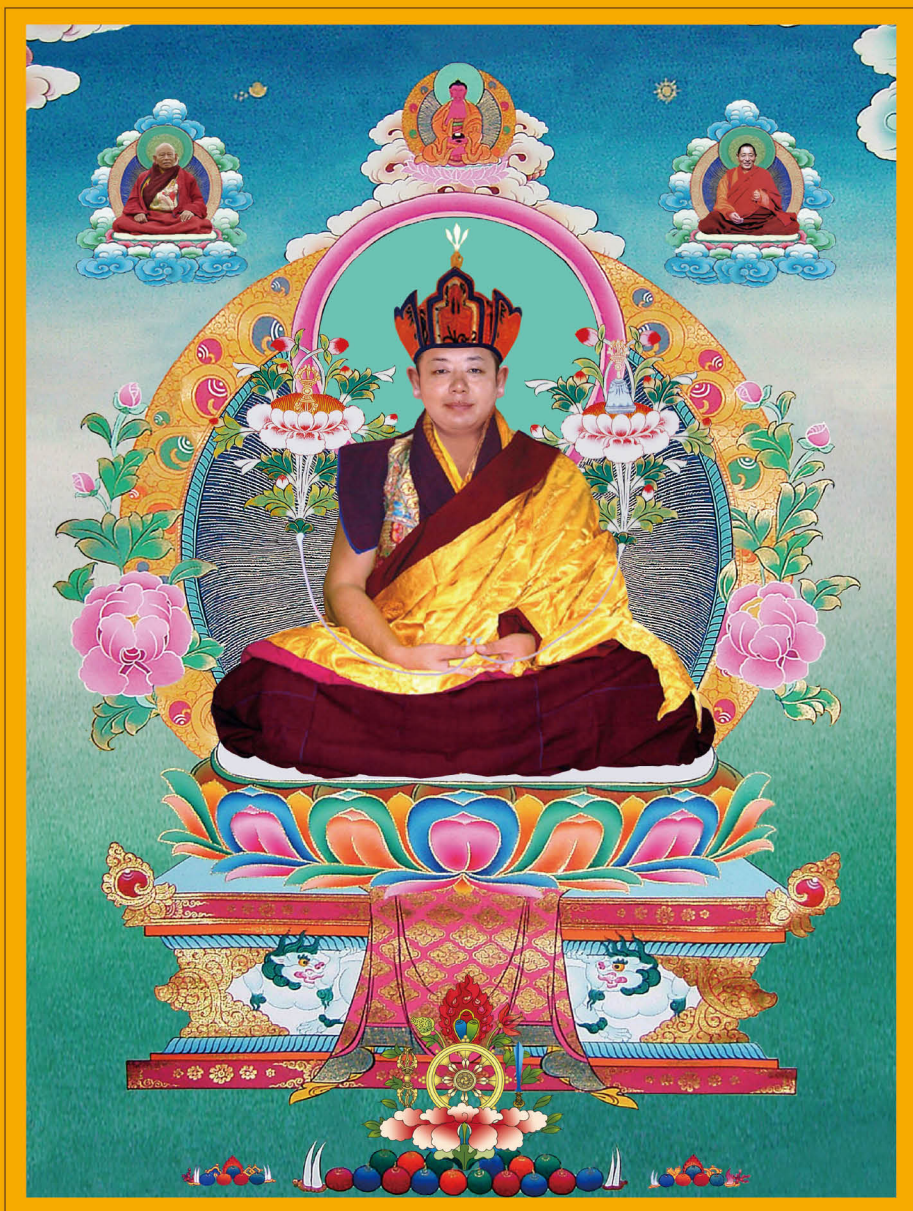
大恩根本上师普巴扎西仁波切